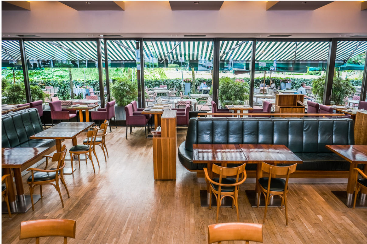
Caféhaus Siesmayer