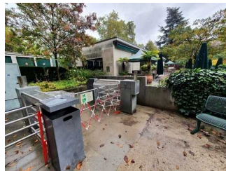
Eingang durch den Palmengarten